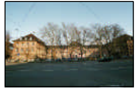
1- Medizinische Klinik (Ludolf-Krehl-Klinik)