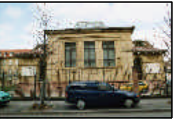
6- OP- und Hörsaalgebäude Medizinische Klinik