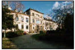
2- Psychiatrische Klinik