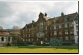
7- Samariter Haus