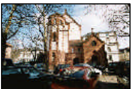
13- Sektionsgebäude Pathologie Chirurgische Klinik