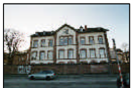
11- Pathologie Institut