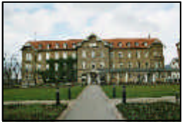
4- Neue Medizinische Klinik