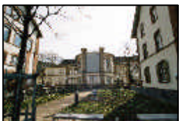
12- OP- und Hörsaalgebäude Chirurgische Klinik