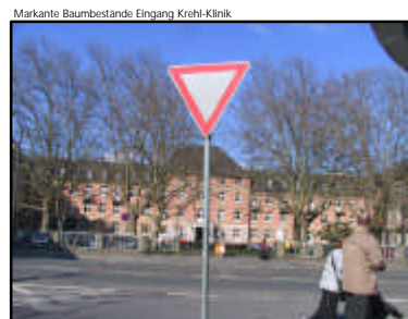
Markante Baumbestände Eingang Krebhi-Klinik