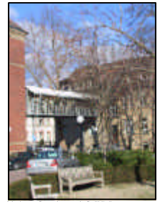
Markante Baumbestände Poliklinik