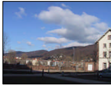
Terrasse am Neckar zw. 4191 u. 4040 m. Blick auf Neuenhalm u. Odenwald