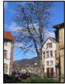
Durchblick Terrasse zw. 4410 u. 4411