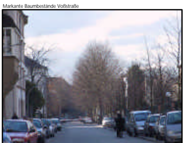
Markante Baumbestände Volzstraße