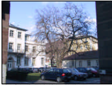
Horstbaum (Paulowitz) - Innenhof östl. Rechtsmedizin 4050