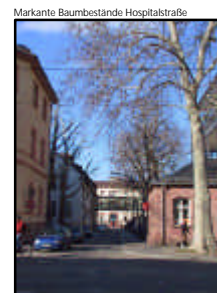
Markante Baumbestände Hospitalstraße