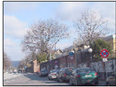
Ganbestände / Mauer entlang B37