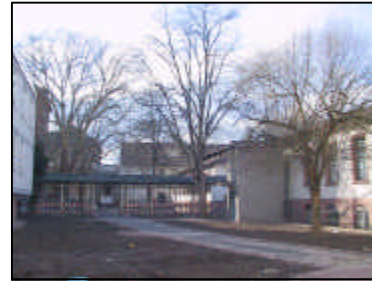
Hautklinik - Innenhof zwischen 4350 u. 4141