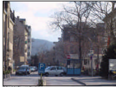
Hübnerstraße - von Norden