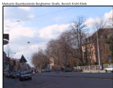
Markante Baumbestände Bergheimer Straße, Bereich Krebhi-Klinik