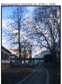
Baumpräzision Innenhof zw. 4140 u. 4340