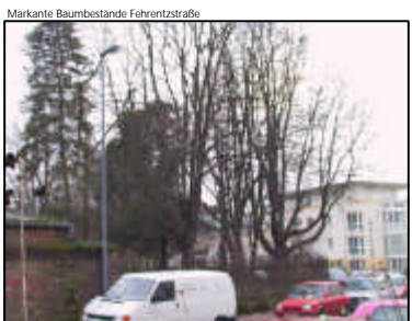
Markante Baumbestände Fehrentzstraße