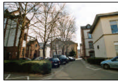
4-unübersichtliche innere Erschließung (Hautklinik)