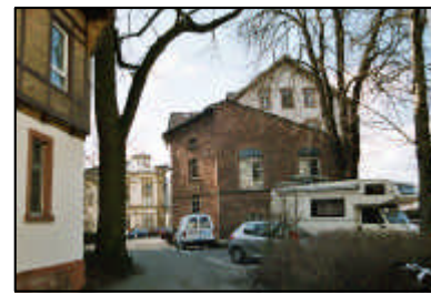
5-unübersichtliche innere Erschließung (Institut für Rechtsmedizin)