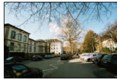
3-Ungeordnetes Parken in wertvollen Grünbereichen / Voßstraße