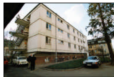
10-Stadtgestalterische Störung im Ensemble / Neubau Hautklinik