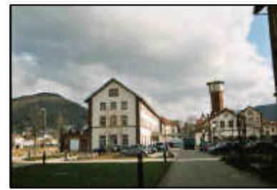
6-unübersichtliche innere Erschließung im Bereich ehemalige Küche