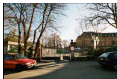
7-Störung von Wegebeziehungen / Eingang Fehrenstraße