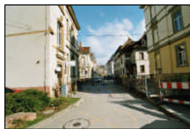
8-Störung von Wegebeziehungen / Eingang Luisenstraße