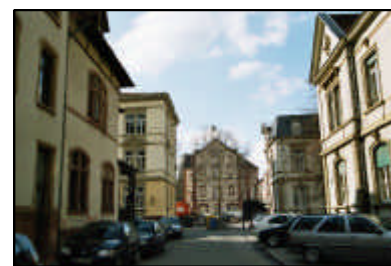
9-Störung von Wegebeziehungen / Eingang Luisenstraße