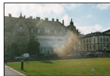
12-Störungen im Ortsbild