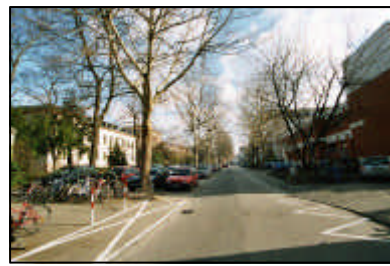
2-Ungeordnetes Parken in wertvollen Grünbereichen / Voßstraße