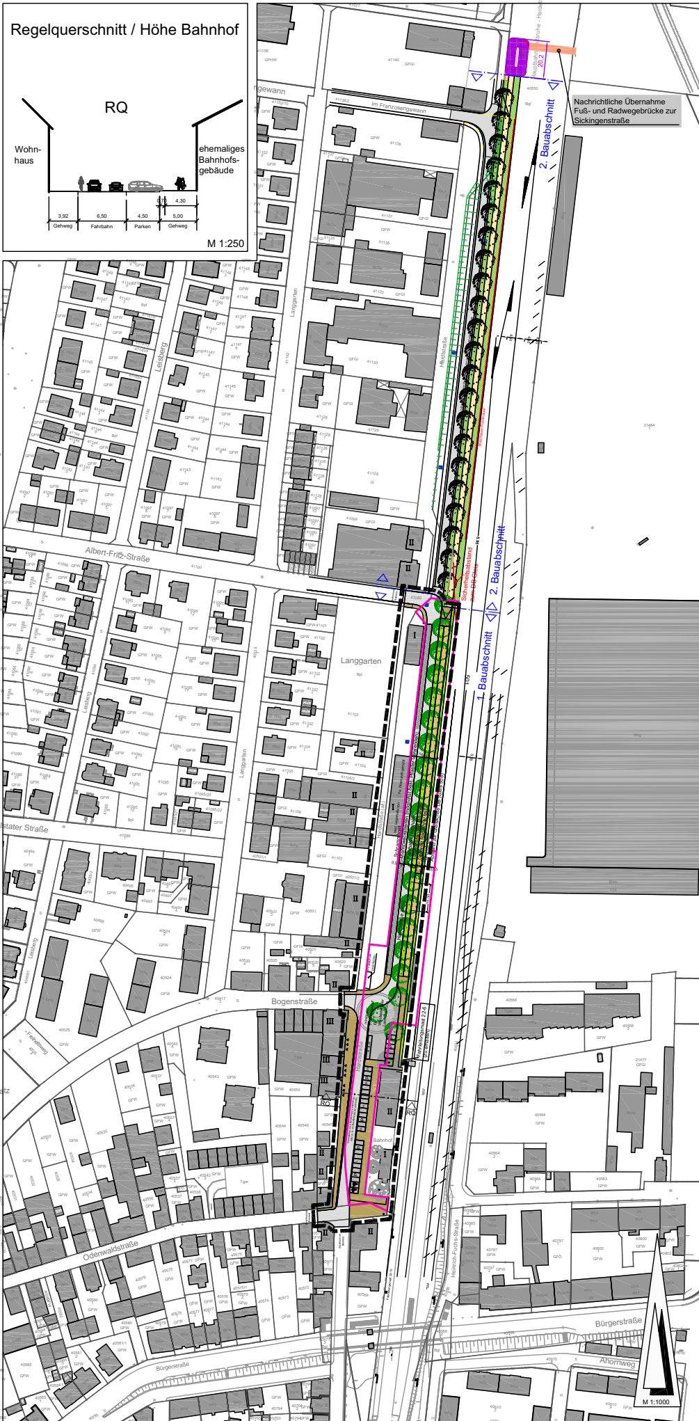
Regelquerschnitt / Höhe Bahnhof