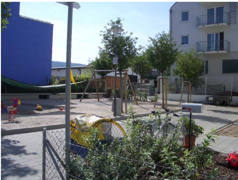
Spielplatz im Eichendorff-Forum

Die Fahrradroute Im Bosseldorn – Franz-Kruckenbergs-Straße verläuft derzeit durch das Eichendorff-Forum. Dort wird der Radverkehr über mehrere rechte Winkel und an einem Kleinkinderspielplatz vorbei geführt (siehe Foto). Eine alternative Führung soll die dort bestehenden Konflikte verringern. Zu diesem Zweck wurden mehrere Varianten überprüft.