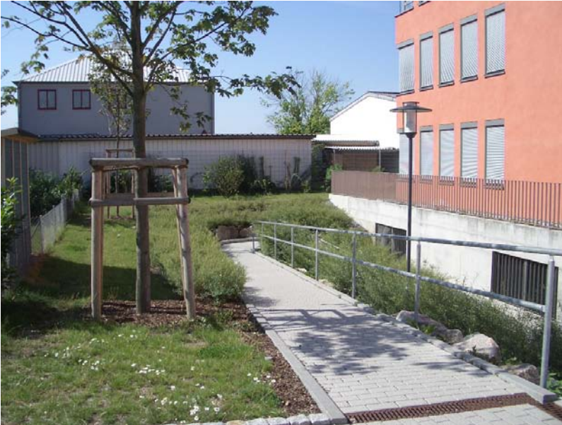
Blick von Norden