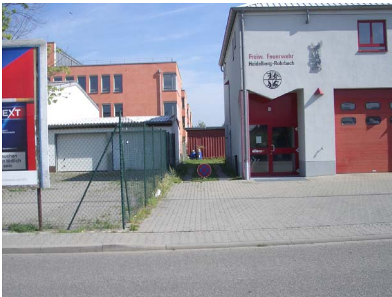
Blick von Süden (Felix-Wankel-Straße)