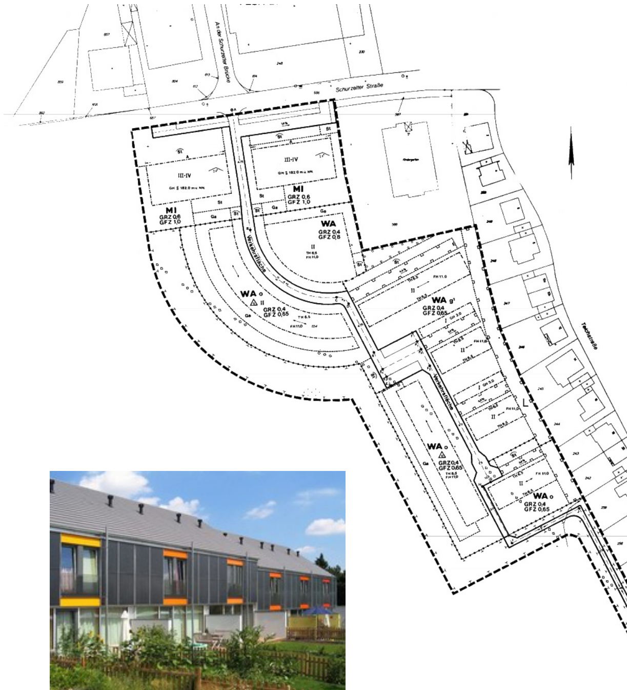
Bebauungsplan und realisierte Gebäude der Solarsiedlung Aachen-Laurensberg

im Auftrag des Klima-Bündnis / Alianza del Clima e. V. und der Städte Aachen, Berlin, Frankfurt, Freiburg, Hannover, Heidelberg und München