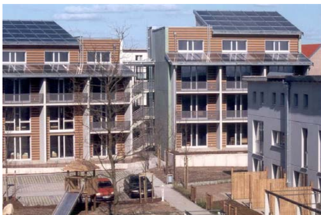
Abbildung: Solare Nahwärme in Hannover-Kronsberg

Eine Sonderform der Nahwärme stellt die solare Nahwärme dar. Die Wärmeversorgung der Gebäude wird hierbei teilweise aus einem Langzeitspeicher gespeist, der die durch großflächige Solarkollektoren gewonnene Wärme bis in den Winter hinein speichert. Die angeschlossenen Gebäude müssen einen niedrigen Wärmebedarf haben und mit Flächenheizungen mit niedriger Vorlauftemperatur ausgestattet sein.