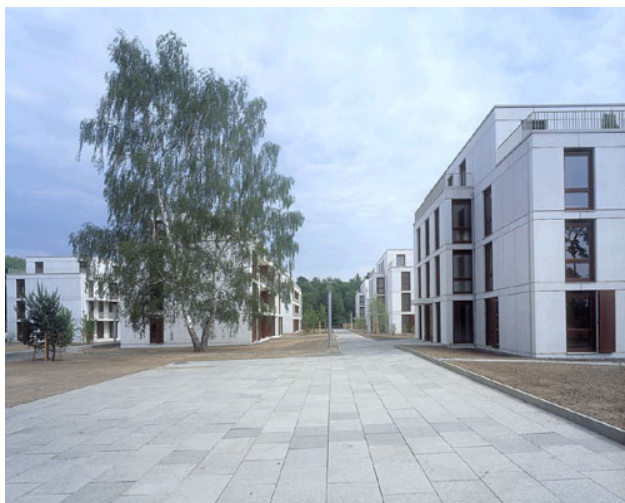
Abbildung: Solarsiedlung Am Petersberg in Berlin-Zehlendorf

In der Energieeinsparverordnung wird dieser Zusammenhang bereits ansatzweise berücksichtigt, indem sie den Jahresheizwärmebedarf mit einer Anlagenzahl kombiniert und zum Jahresprimärenergiebedarf zusammenführt. Die Anlagenzahl berücksichtigt teilweise auch vorgelagerte Brennstoffverbräuche, z. B. bei der Stromheizung. Der Jahresprimärenergiebedarf eines Gebäudes, berechnet nach EnEV, gibt zwar Anhaltspunkte zu den Kohlendioxid-Emissionen, eine genaue Ableitung ist jedoch auf dieser Basis nicht möglich. Notwendig für die CO 2 -Berechnung ist die Benutzung der jeweils aktuellen GEMIS-Werte für die Brennstoffarten und Energieträger. In der GEMIS-Datenbank des Öko-Institutes Freiburg werden die Energie- und Stoffströme genau analysiert. Die dazu ermittelten Werte werden ständig an neue Prozesse und Zusammensetzungen angepasst.