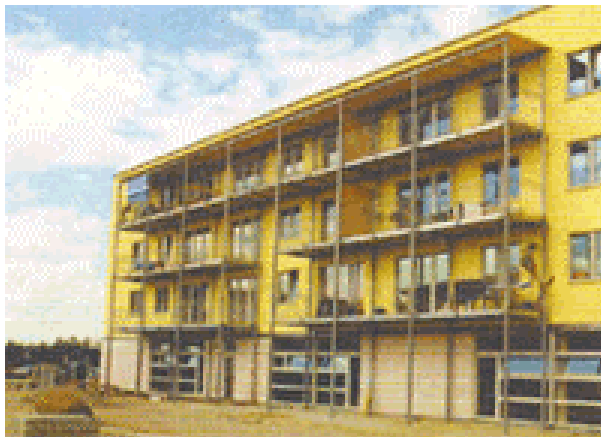
Abbildung: Passivhaus in der Messestadt München-Riem

Energiesparhäuser orientieren sich ebenfalls an den o. g. Merkmalen energieeffizienten Bauens, sind aber etwas weniger aufwendig bei der Vermeidung von Transmissionswärmeverlusten durch die Gebäudehülle (weniger Dämmung, keine Drei-Scheiben-Verglasung). Ihr Jahres-Primärenergiebedarf liegt unter 60 kWh/m 2 a (KfW 60-Haus). Damit ist ihre bauliche Energieeffizienz höher als die von Gebäuden, welche nach den Anforderungen der Energieeinsparverordnung (EnEV) errichtet werden.