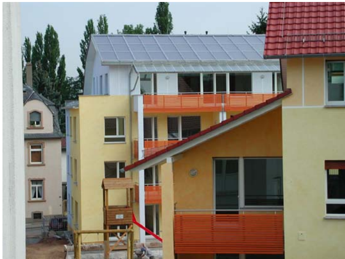
Abbildung: Niedrigenergiehaus-Siedlung „Am Mühlgarten“ in Frankfurt