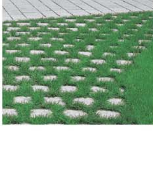
Betonpflasterbelag, grau mit Rasenfugen