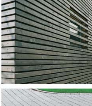
Wildpflanzen-Mischung z.B. Hecken-Waldschatten Fassadenverkleidung, Douglasie oder Lärche, unbehandelt