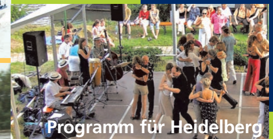
Programm für Heidelberg