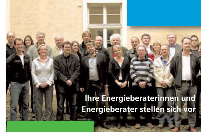
Ihre Energieberaterinnen und Energieberater stellen sich vor

klima sucht schutz in heidelberg ... auch bei dir!