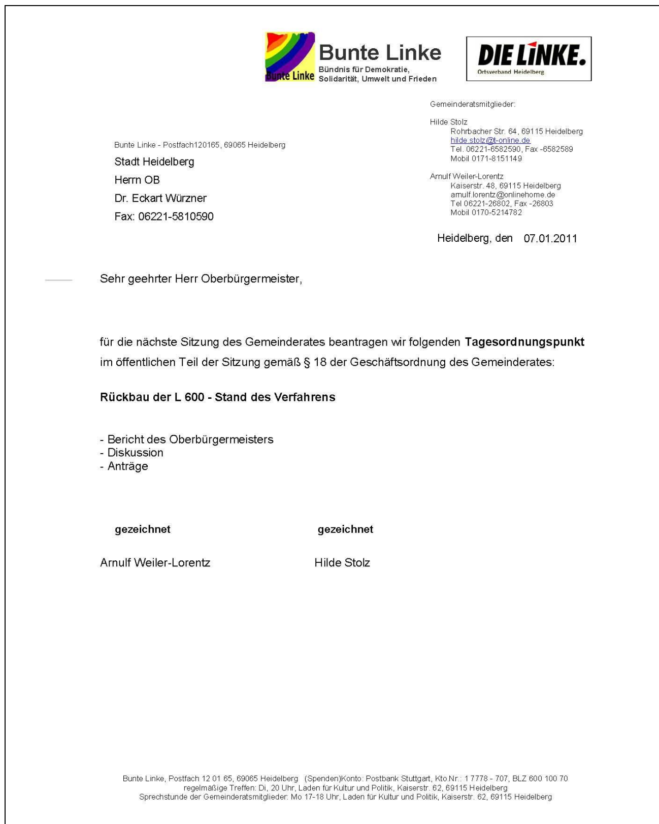
Abbildung des Antrages:

gezeichnet BL/LI, gezeichnet Fraktionsgemeinschaft Grüne/gen.hd