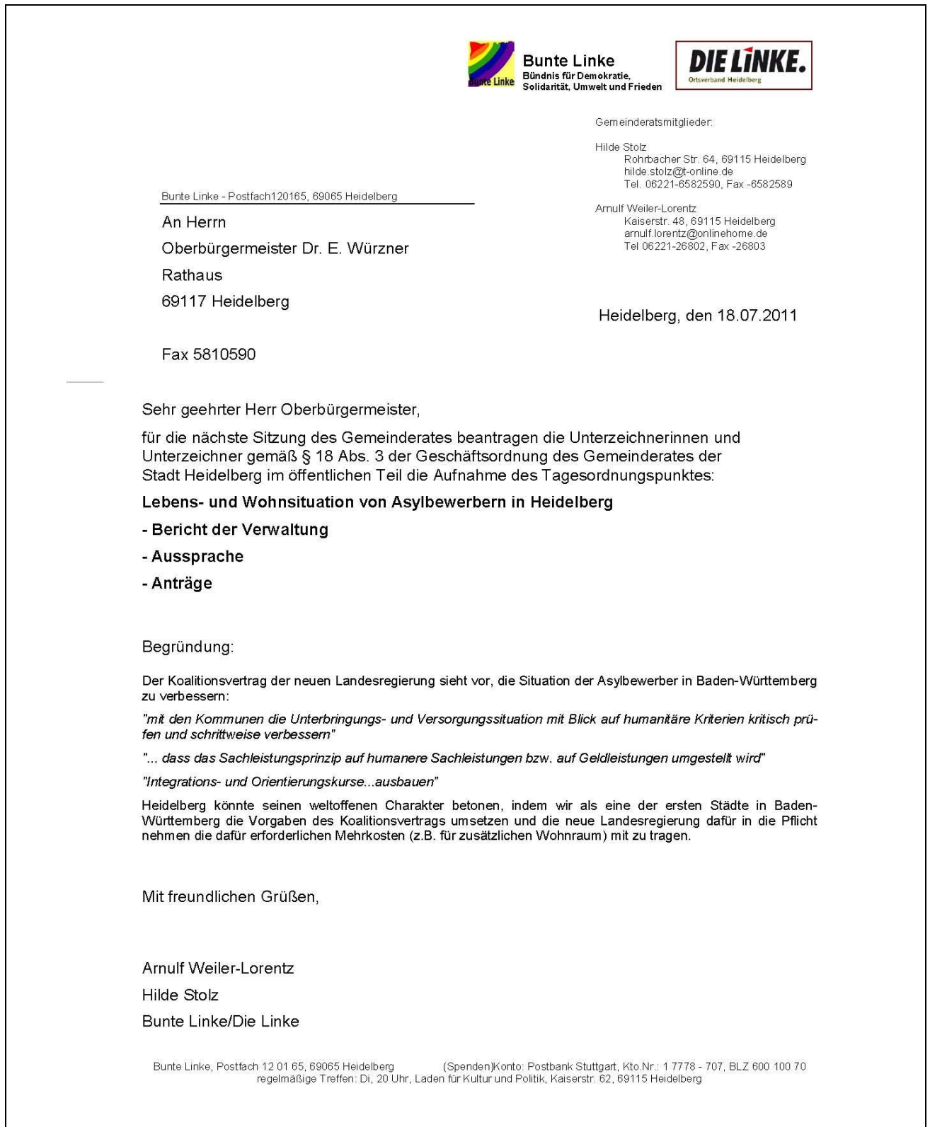
Abbildung des Antrages:

gezeichnet BL/LI, gezeichnet SPD-Fraktion, gezeichnet Fraktion/AG GAL/HD P&E