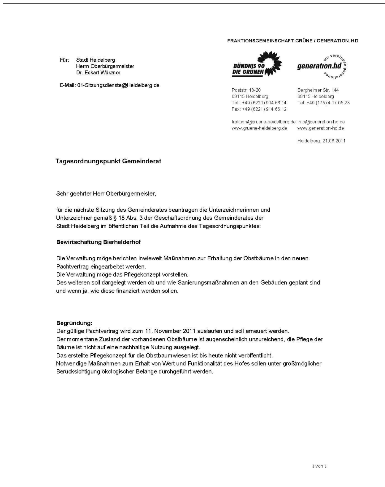
Abbildung des Antrages:

gezeichnet Fraktionsgemeinschaft Grüne/gen.hd, gezeichnet Fraktion/AG GAL/HD P&E