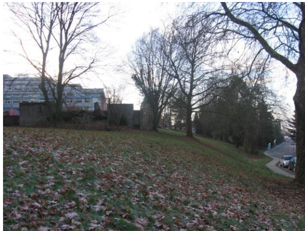
Situation Bäume und Hangschräge