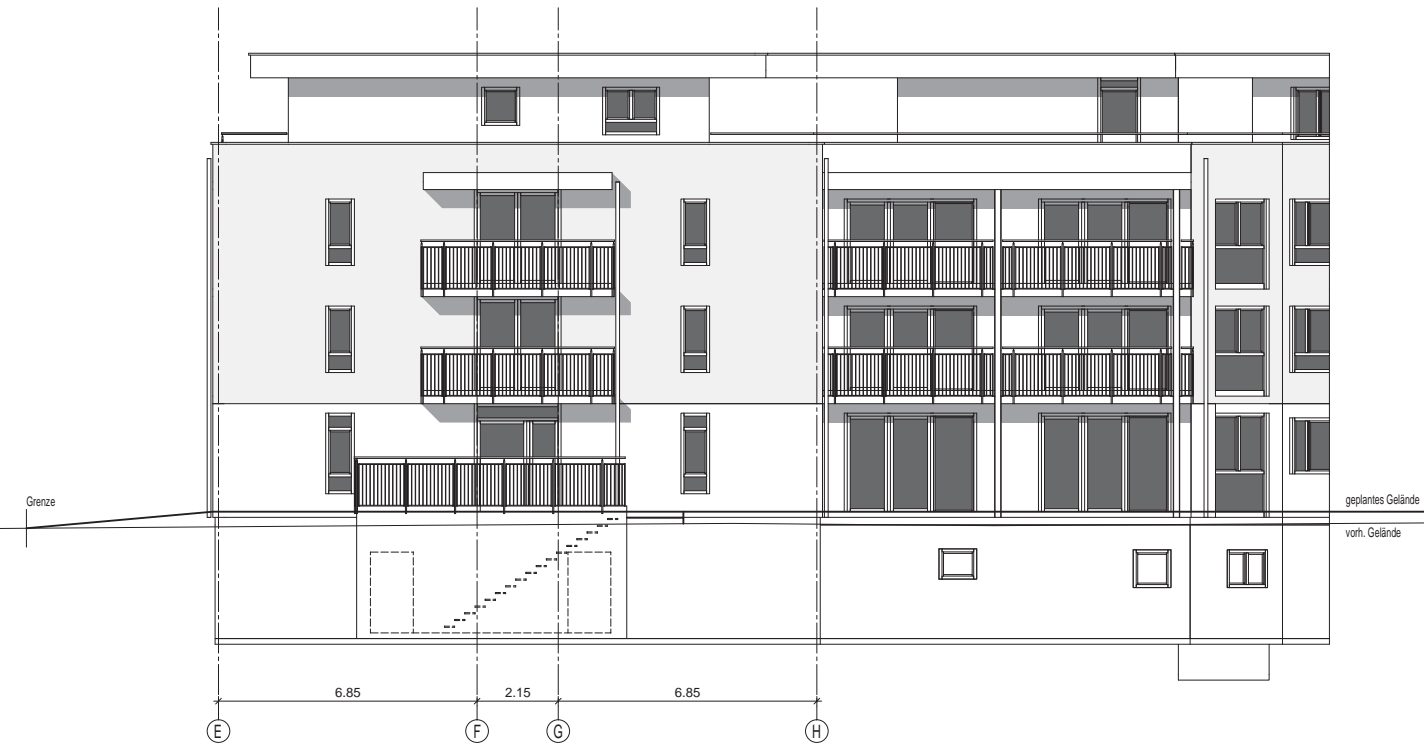
Ansicht Süd / West, Bauteil B