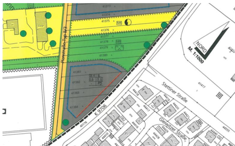
Abbildung: Ausschnitt aus dem wirksamen Bebauungsplan

Das Vorhaben soll auf einer an der Pleikartsförster Straße und dem Schlosskirschenweg gelegenen Fläche, im wirksamen Bebauungsplan „Im Bieth“ als Gewerbegebiet Teilbereich GE 4 festgesetzten Fläche realisiert werden.