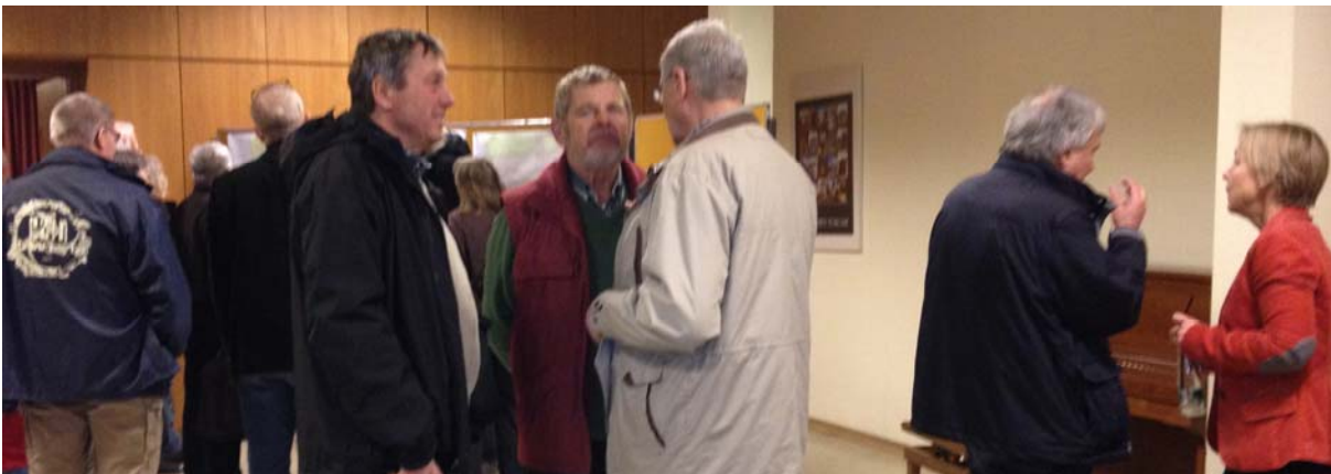
Ausklang mit der Möglichkeit zu Gesprächen am Plan

Vorbehaltlich der Bereitstellung der entsprechenden finanziellen Mittel im Doppelhaushalt 2015/2016 durch den Gemeinderat kann die Umgestaltung des Tiefburgvorplatzes bis Mitte 2016 erfolgen.