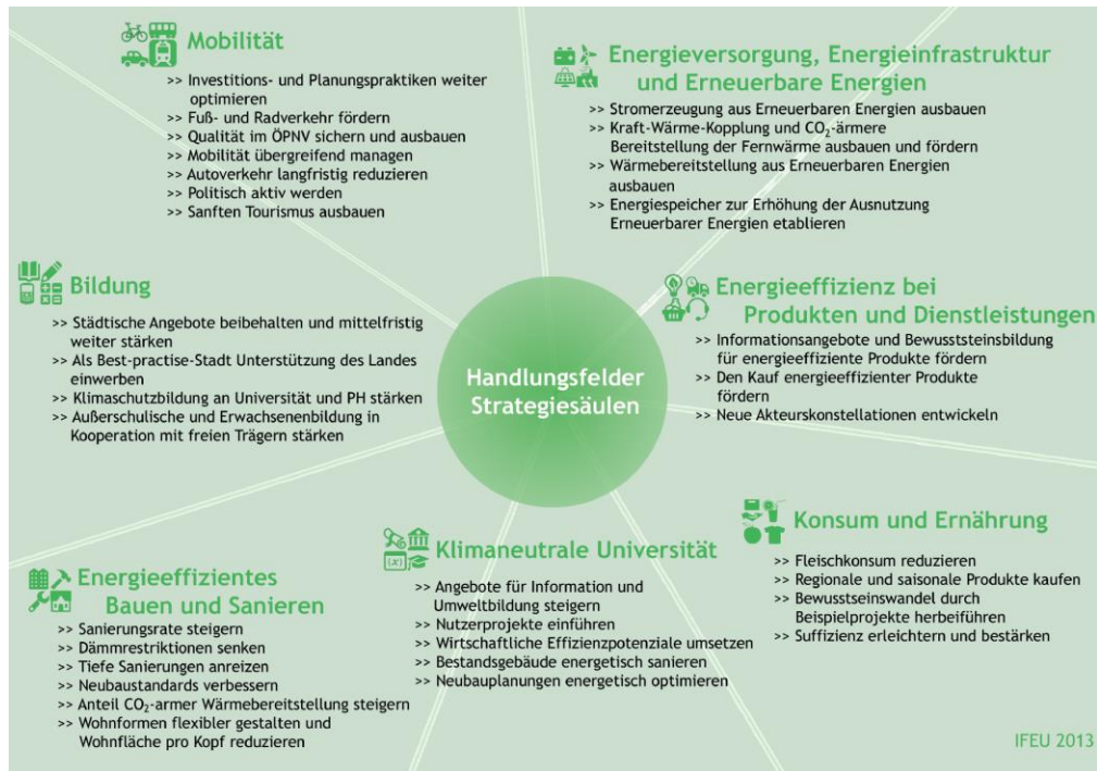
Abb. 2: Übersicht der Handlungsfelder und der dazugehörigen Strategiesäulen für den Masterplan 100 % Klimaschutz

Auf der Grundlage der Szenarioberechnungen (Anlage 1, Kapitel 5) entwickelte das ifeu-Institut Strategieempfehlungen für Heidelberg in folgenden sieben Handlungsfeldern: