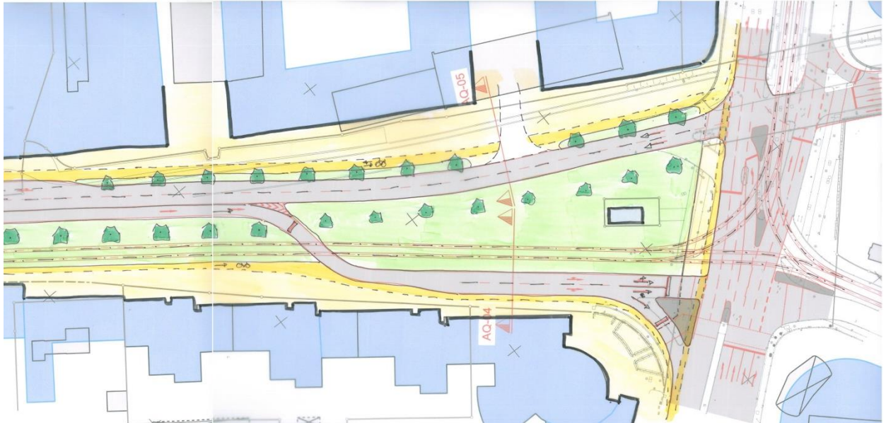
Abbildung: Variante ohne Unterflieger, Vorentwurf Verkehr mit Darstellung Stadträumen

In den Planungen einer Variante ohne Unterflieger hat sich keine Variante herauskristallisiert, die die erforderliche Leistungsfähigkeit in der Abwicklung sicherstellen kann . Dies bedeutet, dass die Auslastung am Knoten so hoch ist, dass keine ausreichende Verkehrsqualität mehr erreicht werden kann.