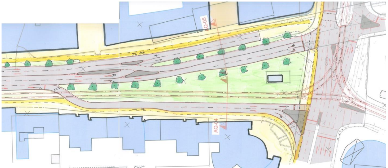
Abbildung: Variante mit Unterflieger, Vorentwurf Verkehr mit Darstellung Stadträumen