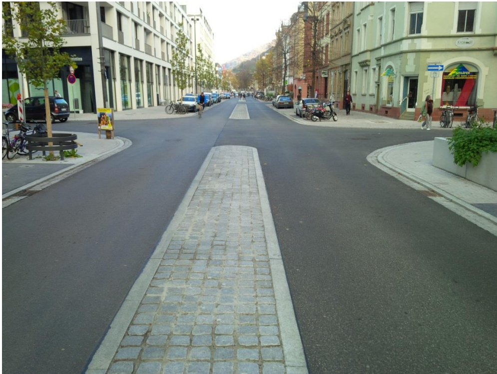
Abbildung 3: Kategorie II – Grundausbau mit Gestaltung und Neuaufteilung des Straßenraums (Hier: Beispiel Bahnhofstraße 2013/2014)