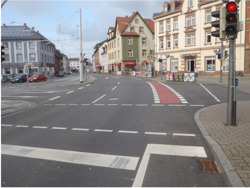
Abbildung 2: Kategorie Ic – Erneuerung der Fahrbahn ohne Querschnittsänderung. (Hier: Beispiel B3, Hans-Thoma-Platz, 2014)

Kategorie II beschreibt schließlich Maßnahmen, bei denen neben der Verbesserung des Straßenzustands weitere städtische Ziele verfolgt werden. Dies können beispielsweise die gestalterische Aufwertung eines Areals oder die Verbesserung der Verkehrsbeziehungen sein. Verwaltungsintern werden solche Maßnahmen ämterübergreifend abgestimmt. Gegebenenfalls ist auch eine Bürgerbeteiligung vorgesehen. Die planerischen Vorlaufzeiten sind dadurch meist deutlich länger.