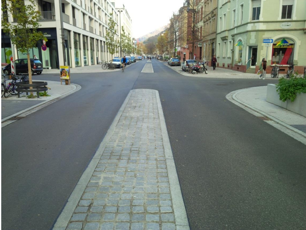
Abbildung 3: Kategorie II – Grundausbau mit Gestaltung und Neuaufteilung des Straßenraums (Hier: Beispiel Bahnhofstraße 2013/2014)