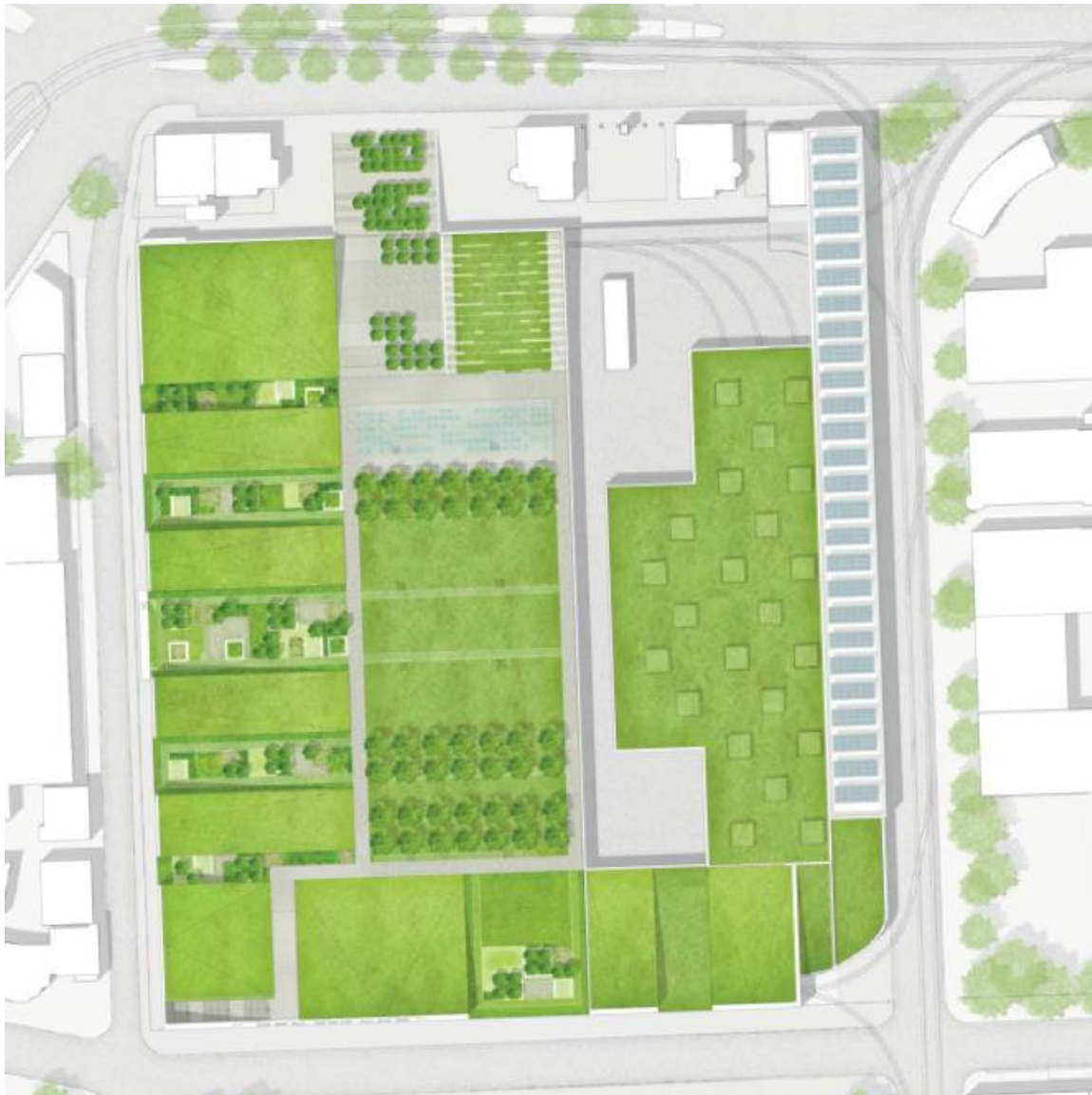
Dachaufsicht Ideenteil (Auszug aus den Plänen der Planungsgruppe)