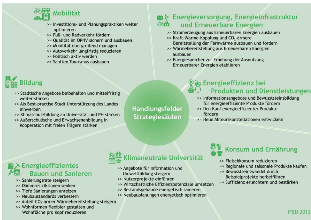
Abb. 1: Übersicht der Arbeitsgruppen beziehungsweise Handlungsfelder und der dazugehörigen Strategiesäulen aus dem Masterplan 100 % Klimaschutz der Stadt Heidelberg

Das IFEU-Institut erstellte im Auftrag der Stadt Heidelberg den Endbericht „Konzept für den Masterplan 100 % Klimaschutz für die Stadt Heidelberg“. Es berechnete mögliche Szenarien, erstellte eine CO 2 -Bilanz für Heidelberg und formulierte Strategiesäulen für die Handlungsfelder zum Erreichen der Klimaneutralität 2050. Sämtliche Maßnahmenvorschläge der Arbeitsgruppen des Heidelberg-Kreises Klimaschutz & Energie wurden dabei berücksichtigt und im dazugehörigen Anhang als Ideensammlung aufgeführt.