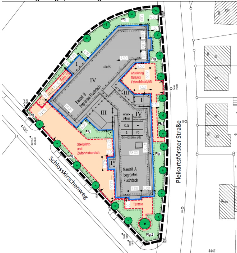
Abbildung: Lageplan Pflegewohnheim

Durch das vom Vorhabenträger geplante Gebäude wird das Rahmenplanungskonzept modifiziert. Das Gebäude wird in einen Bauteil A und einen Bauteil B gegliedert. Die Gliederung der Baumasse in zwei Gebäudeteile ist in Anbetracht der Gebäudelänge und Gebäudehöhe für den Straßenraum Pleikartsförster Straße richtig. Allerdings konnte mit dem Vorhabenträger keine höherwertige Nutzung im Erdgeschoss entlang der Pleikartsförster Straße bzw. im Hofbereich verhandelt werden. Dazu war das Konzept schon zu verfestigt.