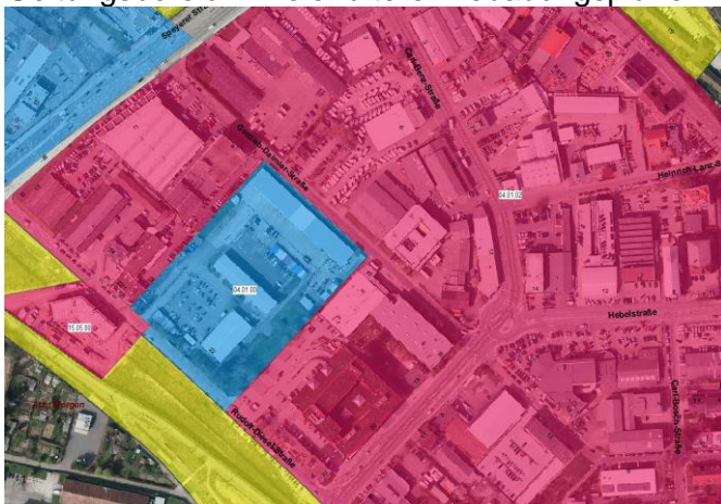
Abbildung: Bebauungsplanübersicht aus dem Georeferenzierten Informationssystem (GIS) der Stadt Heidelberg

Die Grundstücke im Geltungsbereich des aufzustellenden Bebauungsplans liegen im Geltungsbereich zweier älterer Bebauungspläne.