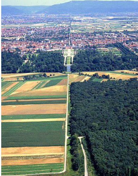
Abbildung: Blick aus westlicher Richtung auf das Schwetzingen Schloss, Schlossachse und Königstuhl, Quellenangabe: Landesmedienzentrum Baden-Württemberg, Bild-Nr. 14505

Abbildung: Liegenschaftskarte mit Geltungsbereich und rot markiert die Lage der früheren Maulbeerallee