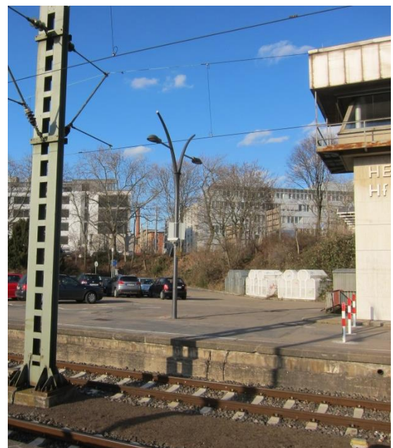
Abbildungen 3 und 4: Grafik Entwicklungen am Bahnhofsvorplatz Nord und Foto der heutigen Situation