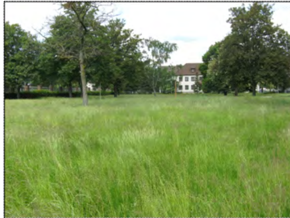
Abbildung (2) Blick auf durchgewachsenen Park-/Nutzrasen frischer Ausprägung, nördlicher Untersuchungsabschnitt

In Teilflächen treten durchgewachsene Park-/Nutzrasen ruderaler Ausprägung mit kleinflächigen Dominanzbeständen auf (siehe Artenlisten A5, A6 und A8, Anhang 1.1; Abbildung 3). Die kleinflächigen Dominanzbestände werden durch Arten wie Kleinem Klee ( Trifolium dubium ), Gundelrebe ( Glechoma hederacea ), Wiesen-Schafgarbe ( Achillea millefolium ), Kiechendes Fingerkraut ( Potentilla reptans ) etc. gebildet.