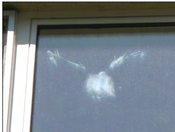
Abbildung (8) Abdruck einer Eule an einer Fensterscheibe, südlicher Untersuchungsabschnitt

Die Anwesenheit von potenziell vorkommenden nachtaktiven Vogelarten (z.B. Wald- und Steinkauz) kann anhand der bisher durchgeführten Begehungen nicht abschließend beurteilt werden. Hinweise in Form von Aufprallabdrücken an Fensterscheiben am Sickingenplatz (siehe Abbildung 8) lassen ein Vorkommen jedoch vermuten.