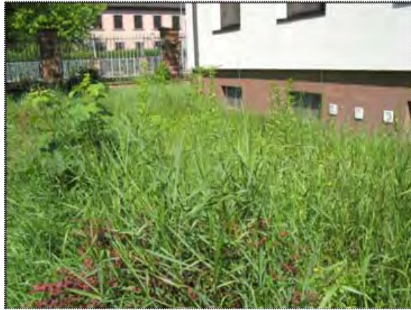
Abbildung (4) Blick auf einen durchgewachsenen Park-/Nutzrasen ruderalisierter Ausprägung dominiert durch Kriechende Quecke ( Elymus repens ), mittlerer Untersuchungsabschnitt

beginnender Verbuschung mit Arten wie Robinie ( Robinia pseudoacacia ), Hybrid-Pappel ( Populus x canadensis ), Götterbaum ( Ailanthus altissima ) und ähnlichen.