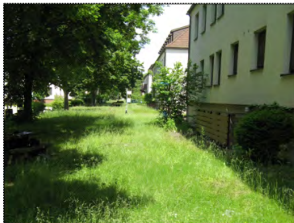
Abbildung (1) Blick auf einen beschatteten durchgewachsenen Park-/Nutzrasen frischerer Ausprägung, nördlicher Untersuchungsabschnitt

Der überwiegende Teil der durchgewachsenen Park-/Nutzrasen ist bezüglich des Standortes der frischeren Ausprägung zuzuordnen (siehe Artenlisten A1, A3 und A4, Anhang 1.1; Abbildung 1). Die hochwüchsigen Bestände werden von Gewöhnlichem Rispengras ( Poa trivialis ) und Rot - Schwingel ( Festuca rubra agg. ) dominiert. Die Bestände sind oft durch stockende Bäume beschattet. Vereinzelt finden sich kleinere Teilflächen, die schütter mit Ruderalarten wie Weicher Trespe ( Bromus hordeaceus ), Vogelmiere ( Stellaria media ) etc. bewachsen sind.