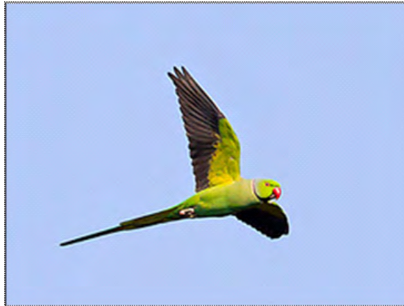
Abbildung (6) Halsbandsittich ( Psittacula krameri)

Unter den erfassten Vögeln befinden sich des Weiteren gebäudebewohnende Arten, die durch die zurzeit leerstehenden Wohnkomplexe ideale Habitatstrukturen in der parkähnlichen Anlage vorfinden. Im Wesentlichen handelt es sich dabei um den in der Vorwarnliste Baden-Württembergs geführten Mauersegler ( Apus apus ) und die in der Vorwarnliste Deutschlands geführte und laut Roter Liste Baden-Württemberg gefährdete Mehlschwalbe ( Delichon urbicum ). Zudem bieten zahlreich vorhandene Hohlräume an Fassaden, Verkleidungen und Dachstühlen Brutplatz- und Unterschlupfmöglichkeiten für verschiedenste Höhlen- und Spaltenbewohnenden Arten (siehe Abbildung 7).