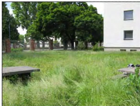
Abbildung (3) Blick auf einen durchgewachsenen Park-/Nutzrasen ruderaler Ausprägung mit kleinflächigen Dominanzbeständen der Gundelrebe ( Glechoma hederacea ), nördlicher Untersuchungsabschnitt

In Teilflächen treten durchgewachsene Park-/Nutzrasen ruderaler Ausprägung mit kleinflächigen Dominanzbeständen auf (siehe Artenlisten A5, A6 und A8, Anhang 1.1; Abbildung 3). Die kleinflächigen Dominanzbestände werden durch Arten wie Kleinem Klee ( Trifolium dubium ), Gundelrebe ( Glechoma hederacea ), Wiesen-Schafgarbe ( Achillea millefolium ), Kiechendes Fingerkraut ( Potentilla reptans ) etc. gebildet.