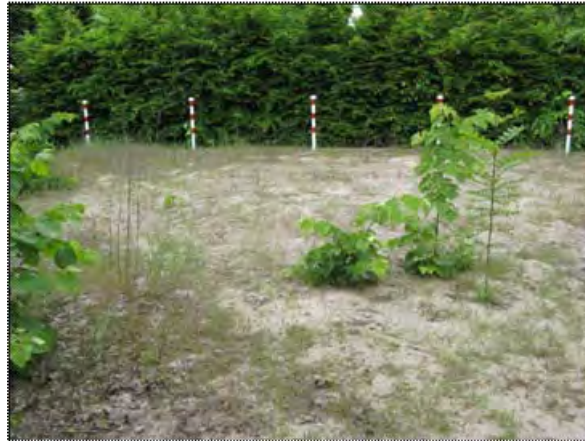
Abbildung (5) Blick auf initiale anthropogene Sand-/Rohboden mit Aufkommen von Sommerlinde ( Tilia platyphyllos ) und Robinie ( Robinia pseudoacacia ), südlicher Untersuchungsabschnitt

Gemäß Schlüssel LUBW entsprechen diese am ehesten den kiesigen oder sandigen Aufschüttungen 21.50 [00].