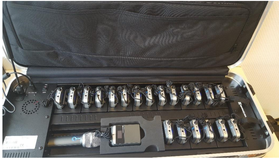
Mobile Induktionshöranlage im Büro der KBB