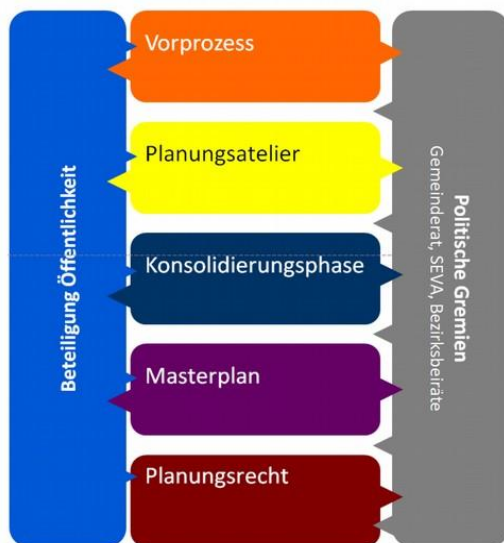
Abbildung 1: Gesamttablauf des Prozesses

Die Öffentlichkeitsbeteiligung zur ersten Phase (Vorprozess) hat wie vom Gemeinderat beschlossen (Drucksache 0004/2018/BV) stattgefunden. Die öffentliche Auftaktveranstaltung fand am 11. April 2018 statt, die Sitzung des Forums am 4. Mai mit Fortsetzungstermin am 18. Mai 2018 und die Online-Beteiligung vom 4. bis 21. Mai 2018. Beteiligungsgegenstand war jeweils die inhaltliche Aufgabenstellung für die Planungsteams. Die Ergebnisse aller Beteiligungsformate sind in der Vorlage "Aufgabenstellung Planungsatelier – Masterplan Im Neuenheimer Feld / Neckarbogen" (Drucksache 0192/2018/BV) dargestellt, die im gleichen Gremienlauf beraten wird.