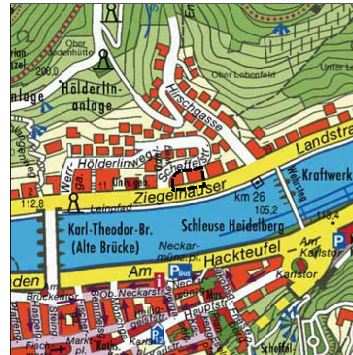
Übersichtsplan M. 1:5 000