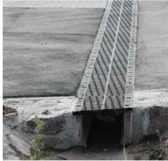
Wohnstraßen verfügen über Kastenrinnen.