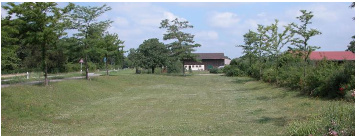
Gestaltungsbeispiel in Heidelberg: Versickerungsbecken

Da in die Planung von Regenwasserbewirtschaftungskonzepten neben den wasserwirtschaftlichen Aspekten auch boden- und naturschutzrechtliche und städtebauliche Belange eingebunden werden sollen, ist eine frühzeitige Abstimmung aller Beteiligten – intern wie extern – unerlässlich!