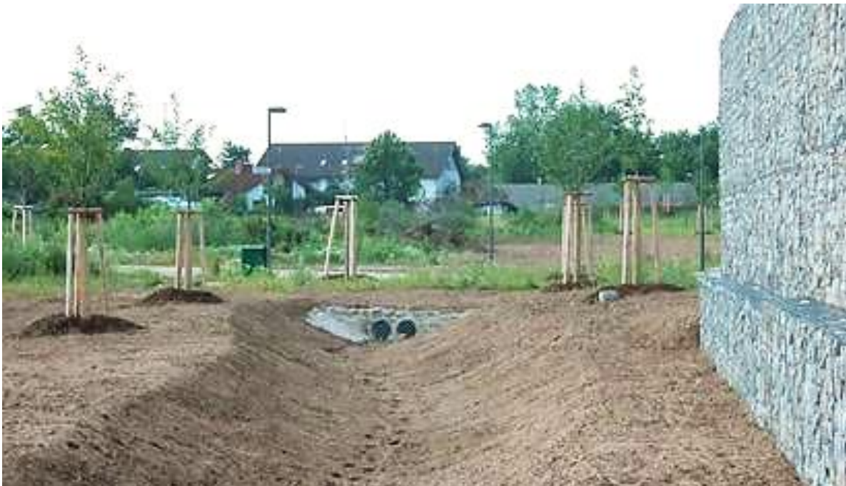
Hier werden die kombinierten Maßnahmen sichtbar: Die Versickerungsmulde mit einer Muldenverbindung. Auf der rechten Seite ist eine Gabionenwand zu sehen, die als Lärmschutz und auch als Lebensraum für Kleintiere fungiert.