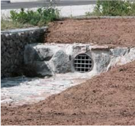
Die Ein- und Auslaufbereiche der Mulden sind mit Wasserbausteinen befestigt.